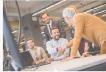
Confronta i risultati