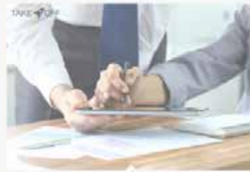
Rapportini su Tablet